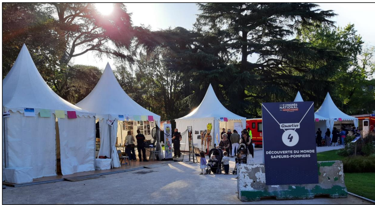
Village Prévention Citoyenneté