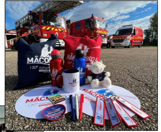
Goodies, accessoires et vêtements à vendre