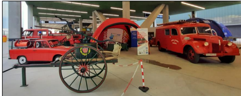
Matériels et engins anciens