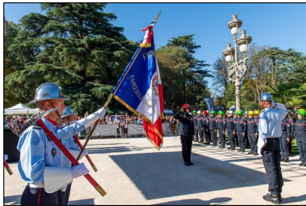
Cérémonie de passation des drapeaux