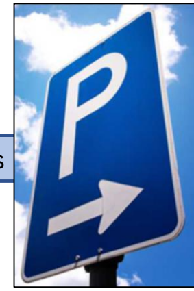
Gestion des Parkings