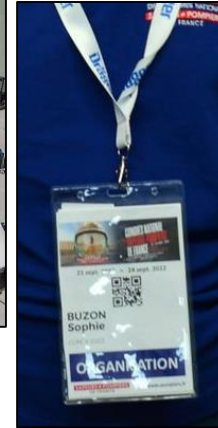
Badges et Pass