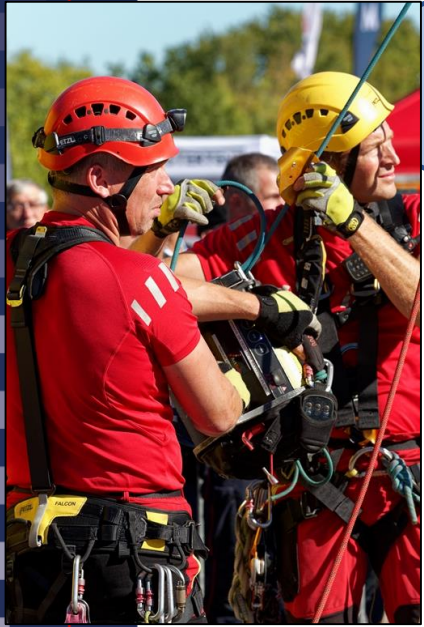
Manœuvres & démonstrations et animations